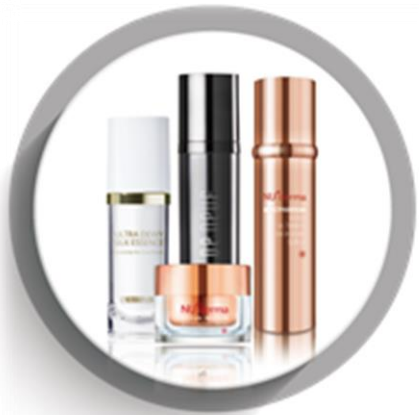
臉部保養 Facial Care