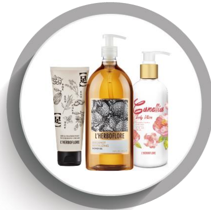
身體保養 Body Care