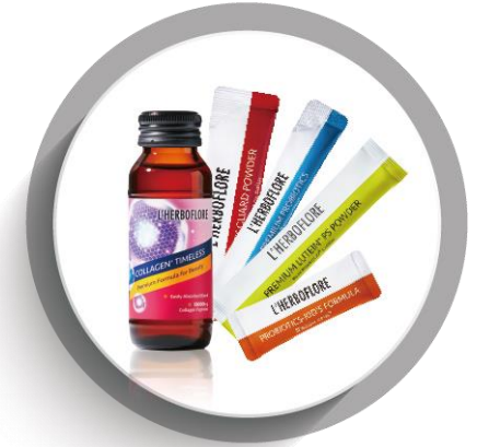
美容健康飲品 Health Care